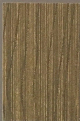
5083 Kivi 2