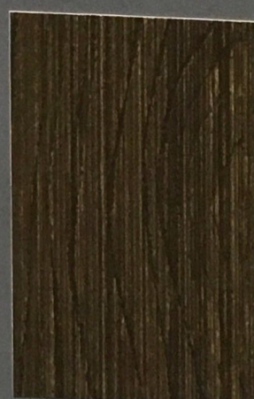
5069 Siimes 2

2. Próbki kolorów przedstawiają odwzorowania dwóch warstw Tikkurila Valtti Color • The color samples on this color card represent two coats of Valtti Color