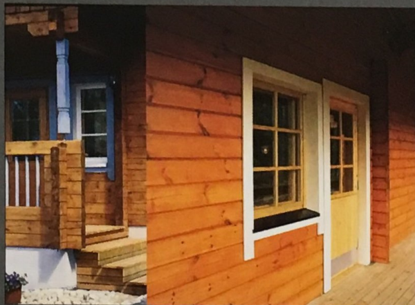
5054 Kantarelli 1