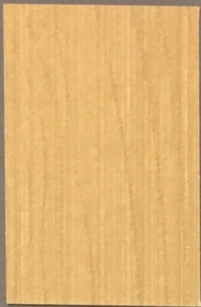
5080 Vasa 3