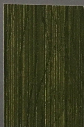
5067 Lieko 2