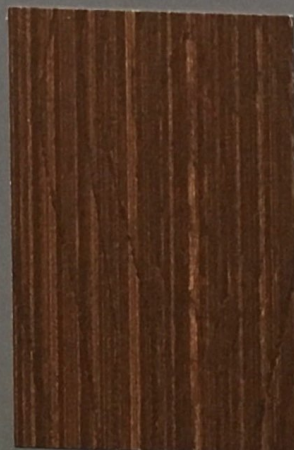
5077 Kanto 2