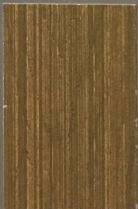
5087 Poro 2