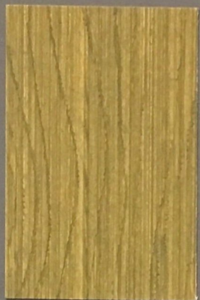
5082 Laavu 2