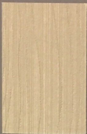
5081 Kaste 3