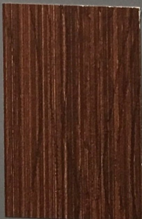
5076 Varpu 2