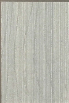
5084 Kajo 2