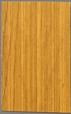
5070 Ruoko 2