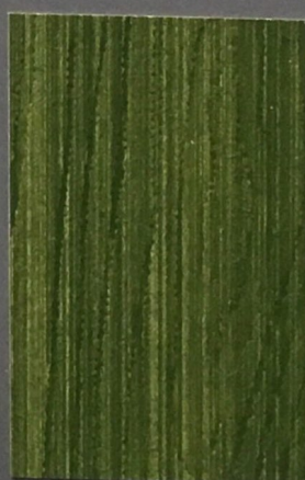
5066 Lehti 2