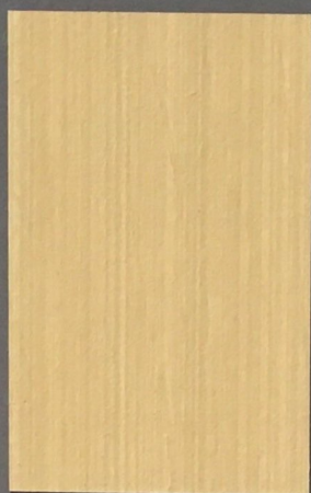
5061 Kaisla 3