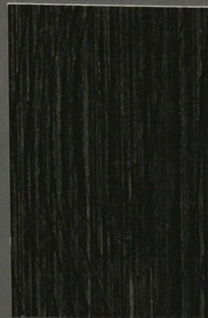
5078 Kataja 2