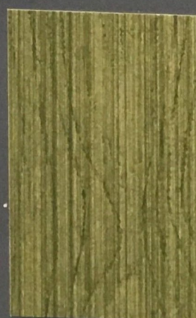
5068 Näre 2