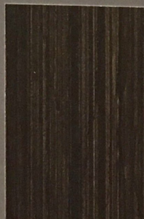
5088 Turve 2