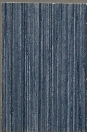
5085 Ilta 2