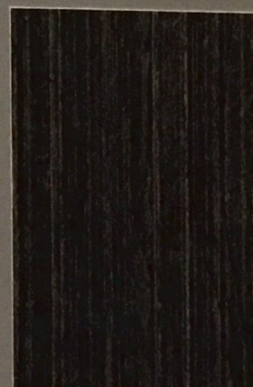
5089 Piki 2

4. Należy wykonać aplikację próbną • Make a trial application