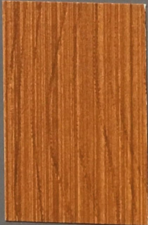
5072 Honka 2