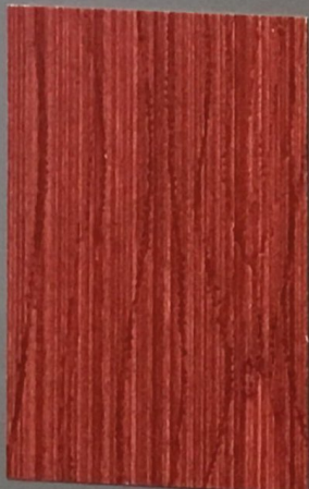
5075 Kihokki 2