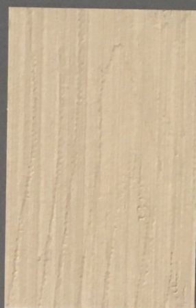
5062 Tuohi 3