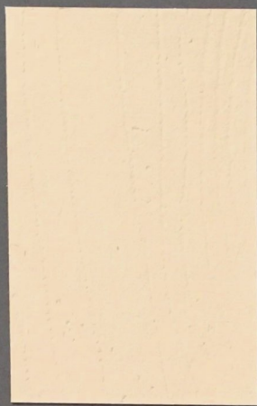
5060 Lumi 3