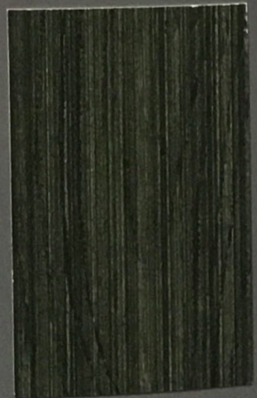
5079 Kuusi 2

3. Efekt końcowy jest uzależniony od rodzaju i ilości użytej bejcy oraz chropowatości powierzchni drewnianych • The final color depends on the type and amount of the wood finish as well as the roughness, quality and porosity of the wood surface