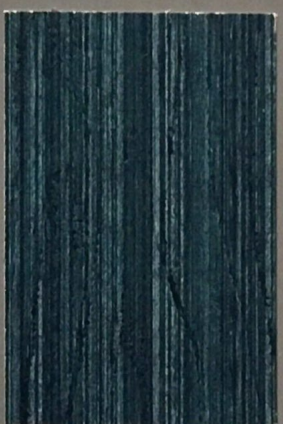
5086 Yö 2