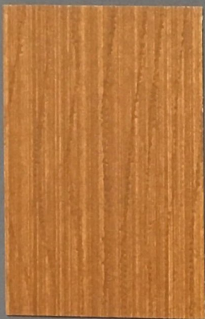
5071 Tatti 2