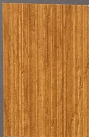
5063 Sora 2