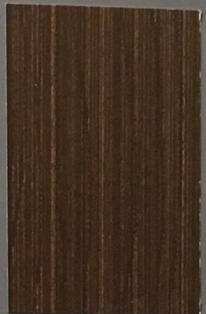
5074 Karhu 2