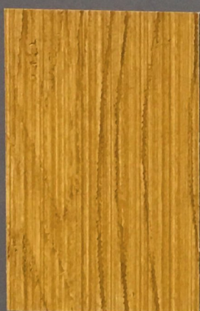
5064 Heinä 2