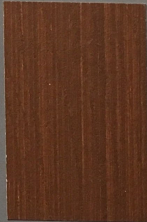
5073 Petäjä 2