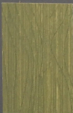
5065 Suvi 3